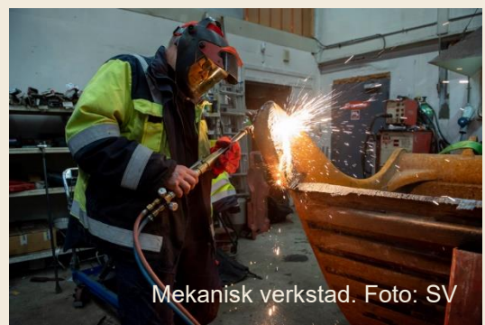
Mekanisk verkstad.