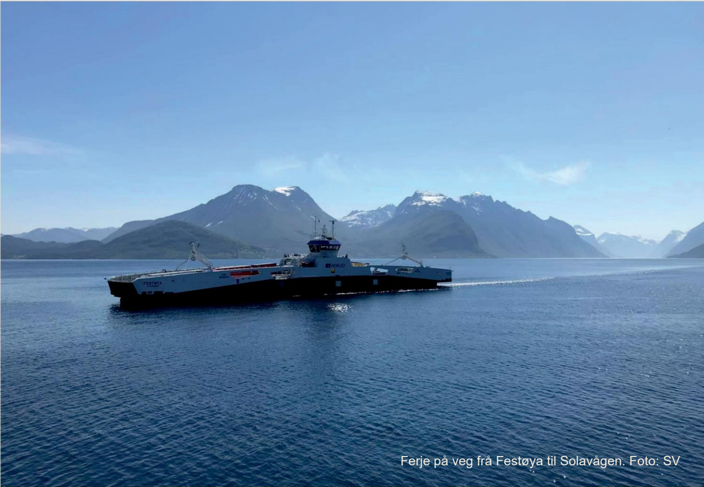
Ferje på veg frå Festøya til Solavågen.