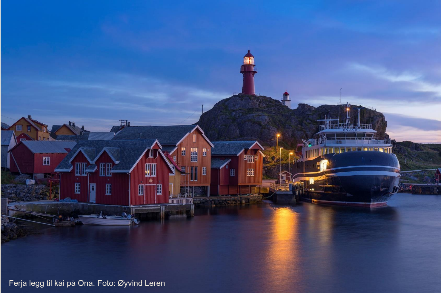
Ferja legg til kai på Ona.