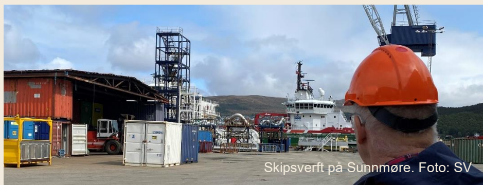
Skipsverft på Sunnmøre. Foto: SV